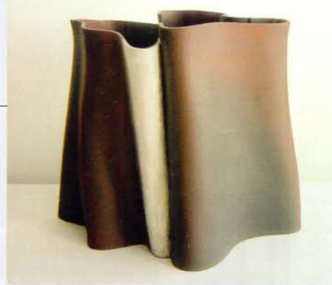
Ken Eastman (Seite 26-30)

ab Seite 36 Feuer im Garb al-Andalus KeramikerInnen trafen sich zum zweiten Mal in Portugal