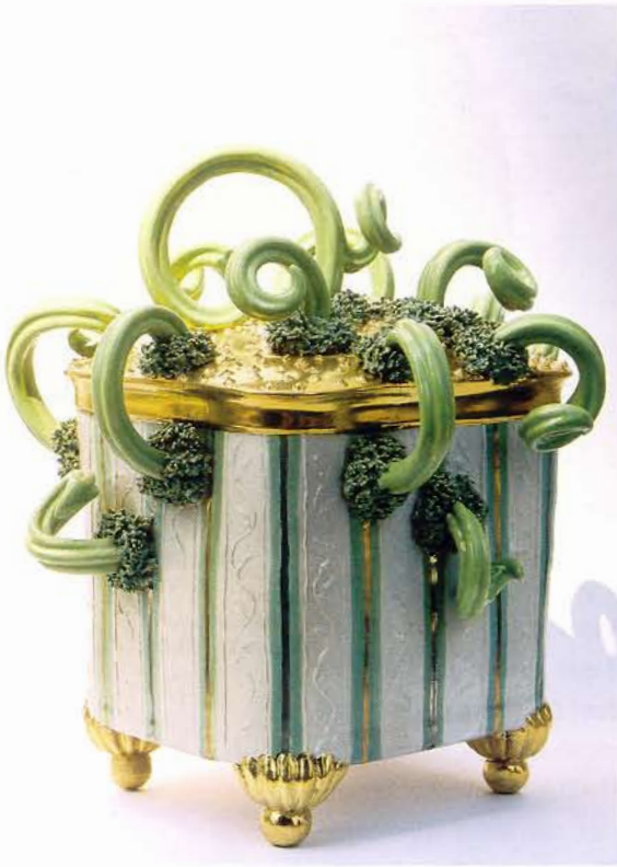
Mystery Coffin, 2006, H 28