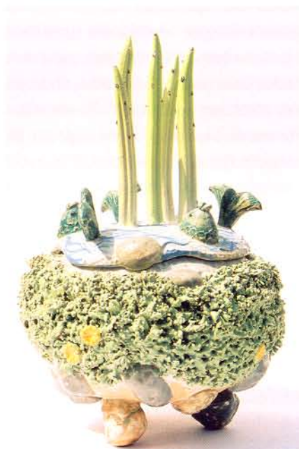
Rechts: Box in landscape, 2006, H 25 cm