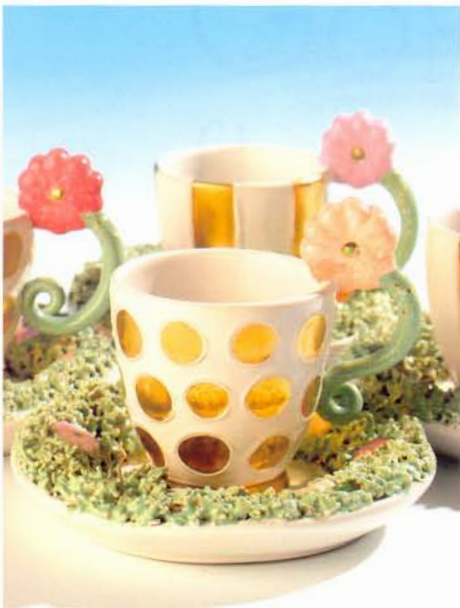
Mokka in Wiese, seit 2003, Tasse H 8 cm, Unterteller Ø 13 cm

Fülle sind Schalen und Dosen mit verschiedensten naturalistischen Applikationen, mit abstrakten Mustern und Strukturen, mit Bildern und sogar Schriftzügen dekoriert: wahre Sammelsurien unterschiedlichster bunter und goldener Zierelemente, die mit manchmal beängstigender Dynamik aus allen Richtungen und von allen Seiten regelrecht Besitz von den Gefäßen ergreifen, selbst von deren Unterseiten.