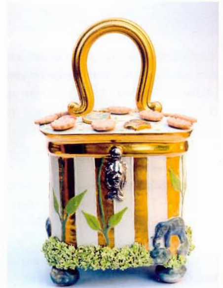
Sehnsuchts Träger, 2006, H 26 cm

Ähnlich der gestaffelten Kulissen eines Theaters dienen die einzelnen Szenen und Elemente konkret dazu, technische Aufbauten zu verzieren und zu verhüllen. In Wahrheit aber stehen sie im Dienste einer fantasievollen Dramaturgie: In ihrem formalen und farblichen Zusammenspiel beschwören sie eine Welt der Illusionen herauf, die sich, sobald sich der Vorhang geöffnet hat, auf die Betrachtenden überträgt – sie womöglich aus ihrer alltäglichen Realität entführt und