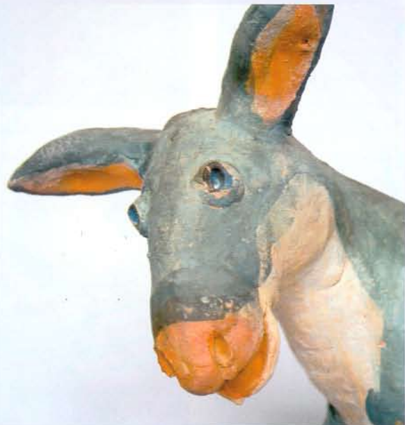
Rüdiger Ludwig (Seite 20-25)