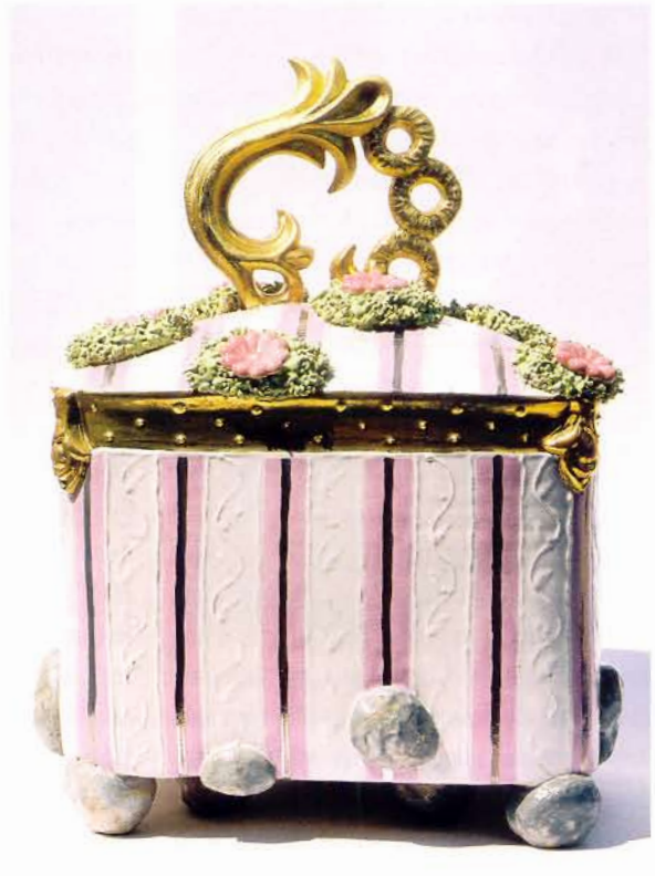
Romantic Coffin, 2006, H 29 cm