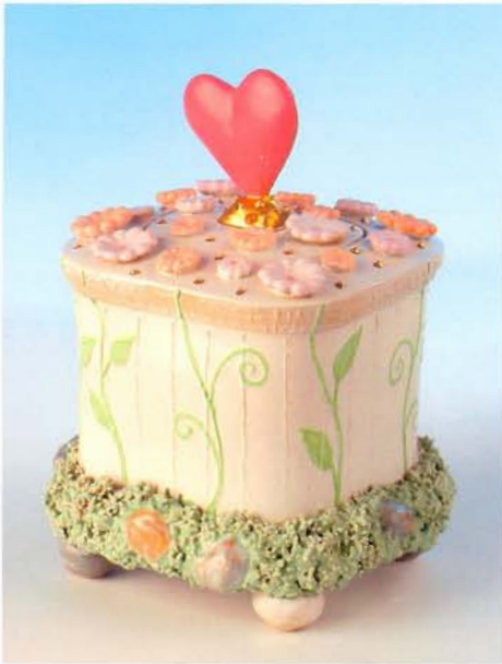
Aufbewahrungsort für Erinnerungen an Dich und mich, 2005, H 18 cm