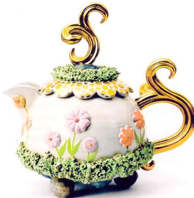
Teekanne in Landschaft, 2006, H 20 cm