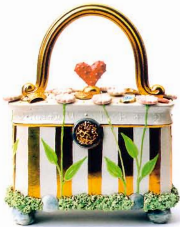
Ich und Du, 2006, H 27 cm, B 22,5 cm, T 11 cm

Metalteile, Holzverzierungen alter Möbel, Praliné-Förmchen, Glasblumen und -herzen ebenso in Gips ab wie alte Militärabzeichen. So entstehen wiederverwendbare Modeln, aus denen immer neue Applikationen für die keramischen Arbeiten hervorgehen. Alte Tapeten mit erhabenen Strukturen dienen dazu, den Unterseiten der Werke zarte Muster einzuprägen.